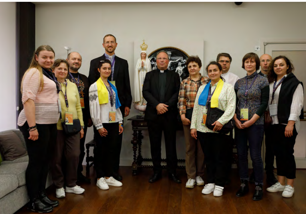
Figura pielgrzymująca Matki Boskiej Fatimskiej, która przez siedem miesięcy przebywała w Ukrainie, odwiedziła w tym czasie piętnaście miejsc w zachodniej części kraju. 26 października członkowie „Misji Fatima-Ukraina” przywieźli do Cova da Iria figurę pielgrzymującą nr 13 i odebrali wizerunek ofiarowany przez Sanktuarium Fatimskie, który został poświęcony podczas międzynarodowej pielgrzymki rocznicowej w maju. Zostanie on teraz zawieszony w inne rejony Ukrainy. Pielgrzymkę przygotowuje już Ukraiński Kościół greckokatolicki we Lwowie we współpracy z „Misją Fatima-Ukraina”.